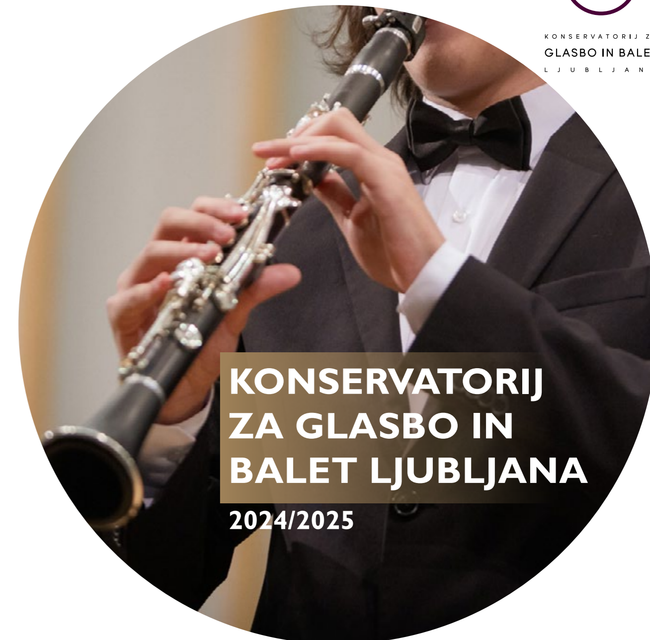
oblikovanje: Danijela Grgič, tisk: PARTNER GRAF, naklada 250.

KONSERVATORIJ ZA GLASBO IN BALET LJUBLJANA 2024/2025